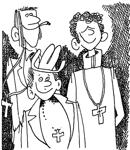
Рис. Е. ШАБЕЛЬНИКА

Да, вполне можно согласиться с ребятами, что они не верят в бога, но в то же время нельзя назвать их и атеистами. И это не какой-то парадокс, а прежде всего проявление мировоззренческой близорукости. А ведь не так уж и безобиден этот крестик — символ христианской религии. Подобные факты заигрывания с религией свидетельствуют о серьезных недостатках в атеистической работе комсомольских организаций.